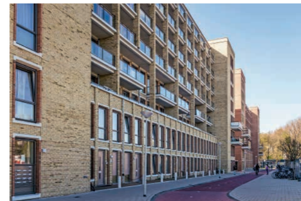
De Titaan, nieuwbouw opgeleverd door Eigen Haard in 2015