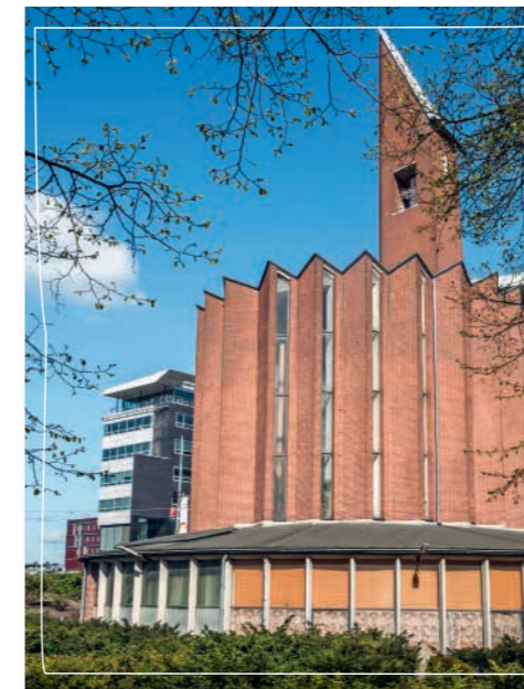
De Opstandingskerk De Kolenkit, waar de wijk naar is vernoemd