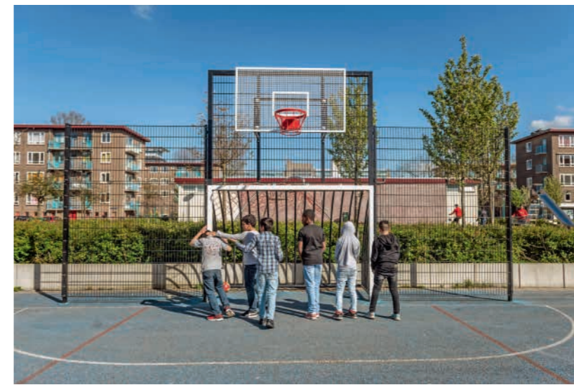
Voetballertjes bij het sportveld Blauwvoetstraat/Ernest Staesstraat