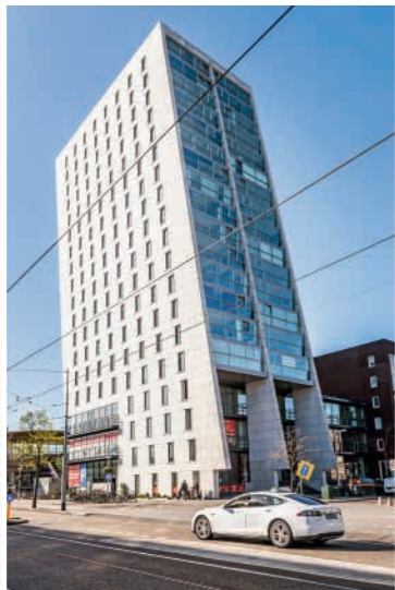
Vijftig meter hoog en schever dan de toren van Pisa. Dat is de New Kit aan de Bos en Lommerweg

TOT 2021 WORDT DE KOLENKITBUURT GRONDIG VERNIEUWD, MET VEEL GROEN EN RUIMTE VOOR GEZINNEN.