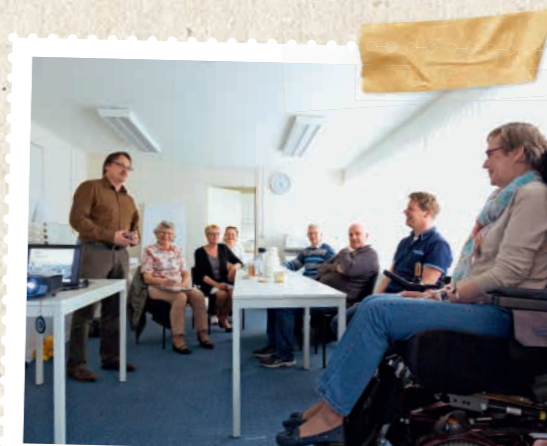
Ans (rechts) tijdens een overleg met de bewonerscommissie

Tien jaar geleden startte de renovatie van negen flatgebouwen aan de Europarei in Uithoorn. De renovatie is al lang afgerond. Maar tijdens de renovatie werd besloten om drie van de negen flats te slopen, om ruimte te maken voor nieuwbouw. De impact van die sloopwerkzaamheden is groot. De bewoners van de 381 woningen moeten verhuizen.