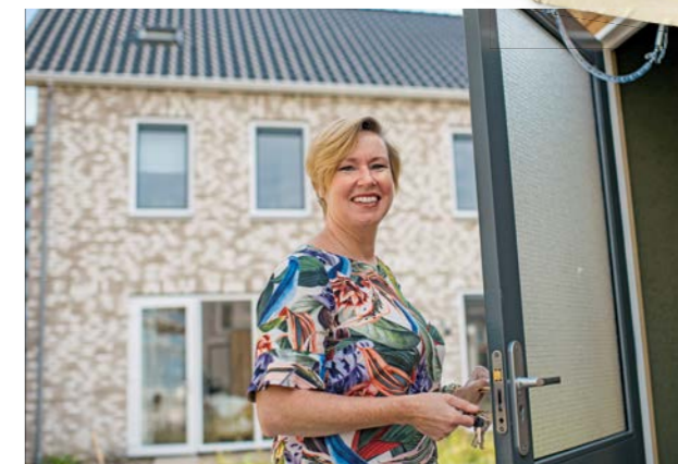
Eigen Haard heeft ook een gevarieerd aanbod koopwoningen.

Bent u op zoek naar een andere woning? Heeft u al eens overwogen om te kopen? Als huurder van Eigen Haard koopt u voor een vaste prijs en krijgt u voorrang op andere kopers. U vindt ons gevarieerde aanbod koopwoningen, zowel bestaande als nieuwbouw-woningen, op kopenbijeigenhaard.nl .