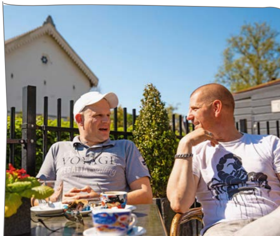
Even pauze met een kopje koffie. Fijne terrassen in Landsmeer...

'ALS ZE EEN HEK OM LANDSMEER ZOUDEN ZETTEN, ZOU DAT NIET ERG ZIJN. LANDSMEER HEEFT GEWOON ALLES.'