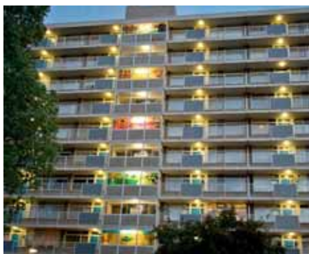
De winnaar van het Eigen Haard fonds 2010: Camera Obscuralaan, Amstelveen.