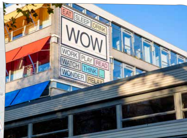
Oud schoolgebouw wordt WOW

In 2009 is Eigen Haard gestart met het vervangen van oude woningen door nieuwbouw in het middengebied van de Kolenkitbuurt. Na de New Kit, Titaan, Meesters, de nieuwe Bos en Lommerschool en Dichters starten we begin 2020 met de bouw van de laatste 126 woningen.