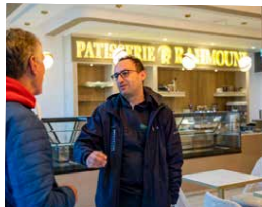
Lekkere uren bij Rahmouni

In 2009 is Eigen Haard gestart met het vervangen van oude woningen door nieuwbouw in het middengebied van de Kolenkitbuurt. Na de New Kit, Titaan, Meesters, de nieuwe Bos en Lommerschool en Dichters starten we begin 2020 met de bouw van de laatste 126 woningen.