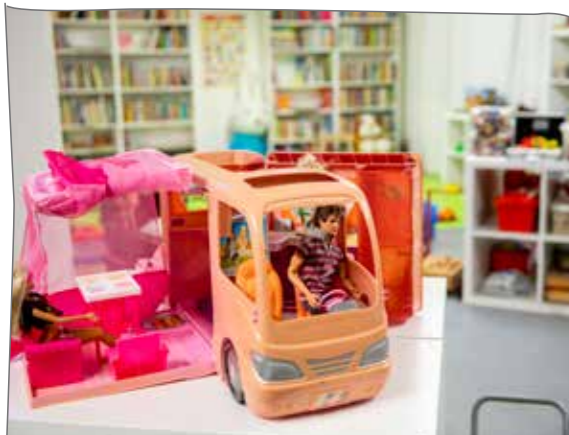
De Speelgoedbank bij Buurt Activiteitencentrum Kolenkit