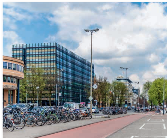
Amstelcampus combineert onderwijs, voorzieningen en studentenwoningen.