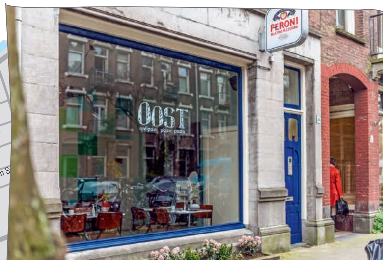
Fantastisch Italiaans Restaurant 'Oost' in de Andreas Bonnstraat. Deze straat en de Van Muschenbroekstraat gaat Eigen Haard vanaf 2018 renoveren.

DE GEZONDE STAD WERKT ACTIEF SAMEN MET GEMEENTE, WONINGCORPORATIES EN BEWONERS AAN HET VERGROENEN VAN DE BUURT