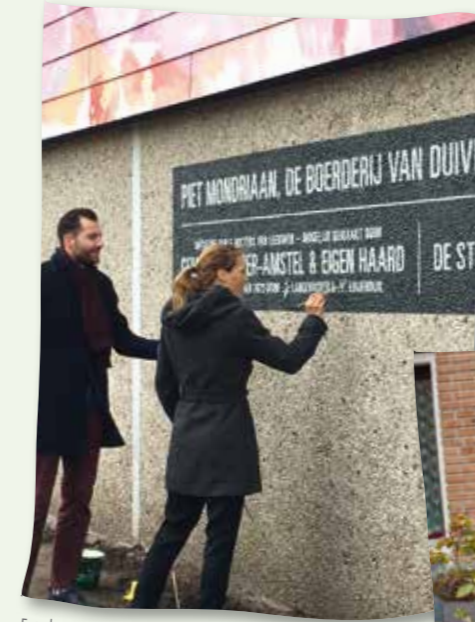
Een handtekening onder de gigantische Mondriaan.