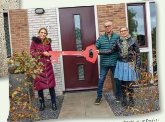
De sleuteloverdracht in De Kwakel.