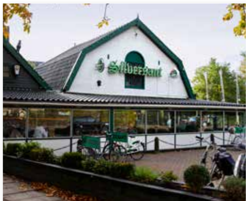
Na een wandeling door het Amsterdamse Bos, de ideale plek voor warme chocolademelk met slagroom.