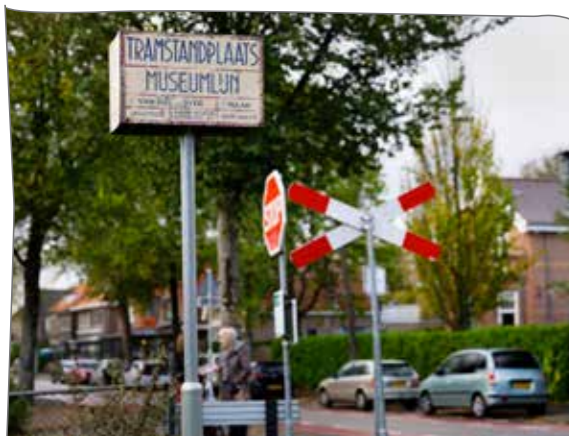
De historische tram rijdt geregeld vanuit Amsterdam tot aan Bovenkerk.

TIP Bezoek het Bloesepark met 400 Japanse kersenbomen in het Amsterdamse Bos, ook in de winter speciaal. Japanse expats vieren er picknickend hun Kersenbloesemfeest.