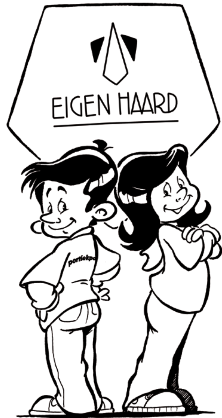
Tekening: Tekenteam (Mark Spruijt)