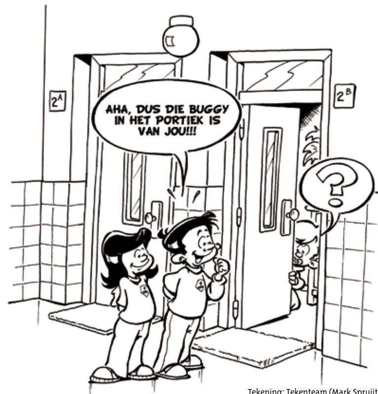
Tekening: Tekenteam (Mark Spruijt)