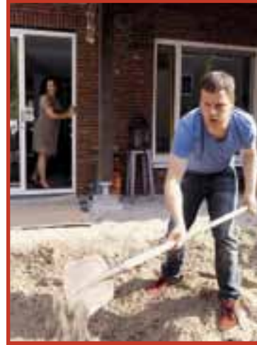
Aan de achtertuin wordt nog hard gewerkt

Batjanstraat 1 De Batjanstraat 1 is grondig aangepakt. De 12 nieuwe kantoorunits worden verhuurd aan organisaties die gerelateerd zijn aan kunst, cultuur en muziek of met een maatschappelijke doelstelling.