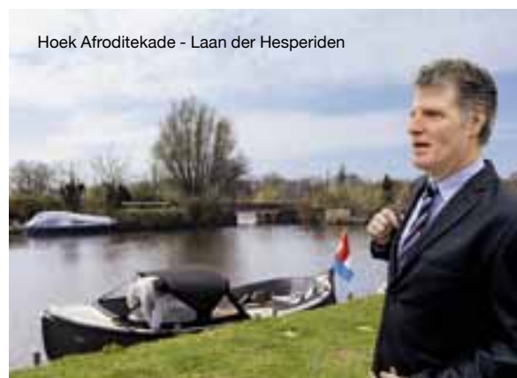
Hoek Afroditekade - Laan der Hesperiden

'Hier aan het water lijkt wel of de tijd heeft stilgestaan'