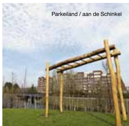
Parkeiland / aan de Schinkel