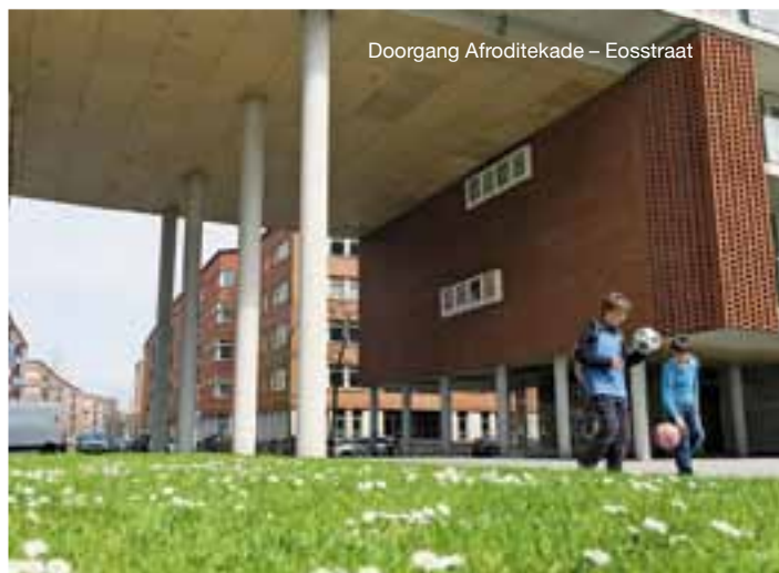
Doorgang Afroditekade – Eosstraat