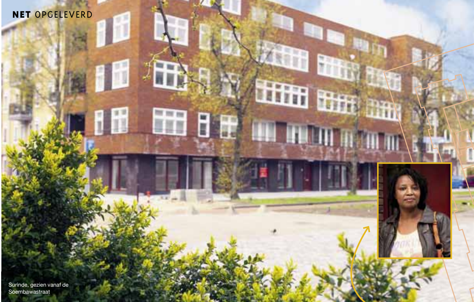
Surinde, gezien vanaf de Soembawastraat

Surinde: een aanwinst voor de Indische buurt in Amsterdam