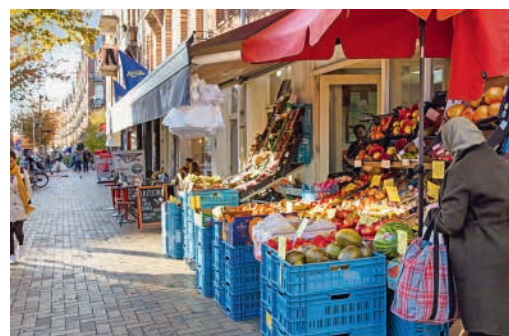
In de Javastraat vind je talloze gezellige winkels.

'EIGEN HAARD HEEFT DE AFGELOPEN JAREN 450 HUIZEN GERENOVEERD IN DE INDISCHE BUURT. WE BEREIDEN NU DE RENOVATIE VAN 240 HUIZEN VOOR. DAARNAAST BOUWEN WE 160 NIEUWE WONINGEN EN DE KOMENDE JAREN KOMEN DAAR NOG EENS 160 WONINGEN BIJ.'