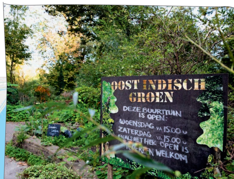
Buurttuin Oost Indisch groen