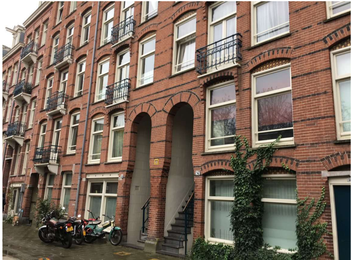
Rustenburgerstraat 243 - 255