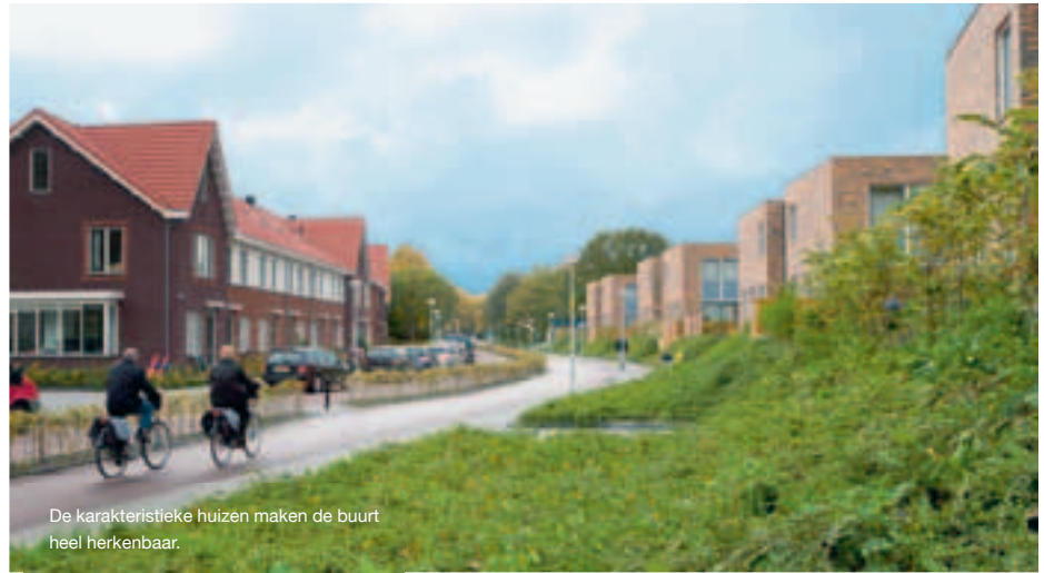
De karakteristieke huizen maken de buurt heel herkenbaar.