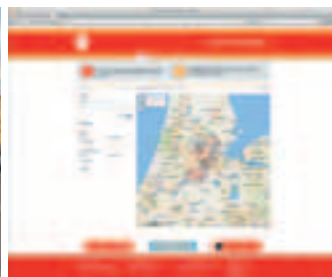
Parkeerplekken van Eigen Haard aan de Hestiastraat in Amsterdam.