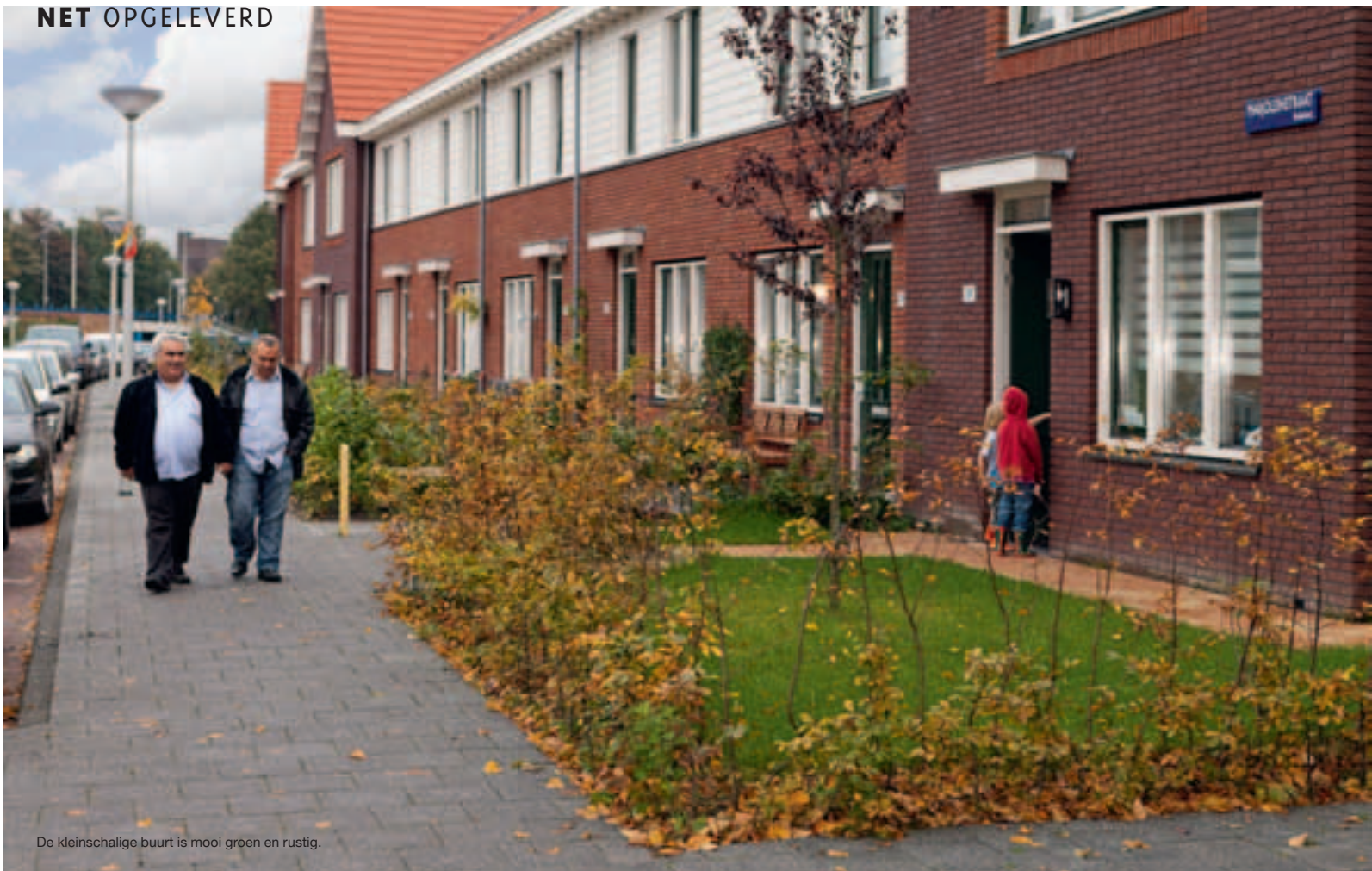
De kleinschalige buurt is mooi groen en rustig.

Een gewild stukje Amsterdam met een goede prijs-kwaliteitverhouding