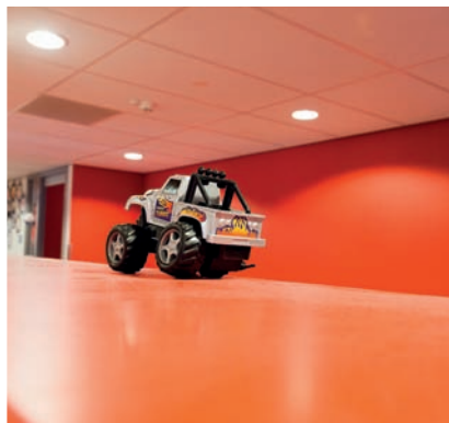
'De buitenkant met die mooie gekleurde platen is heel vrolijk'