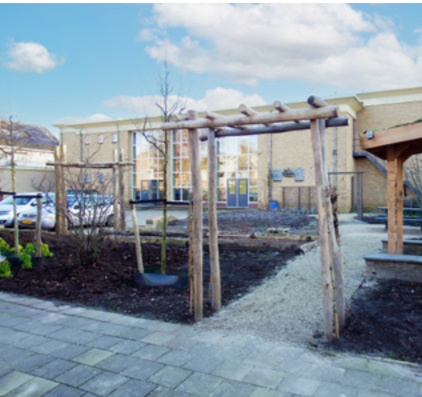
Nog even geduld...de tuin is pas ingezaaid. Straks in volle bloei!