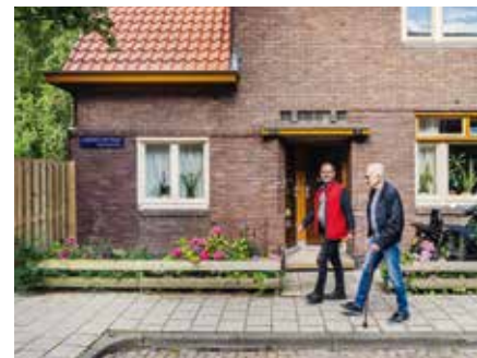
De huizen kregen dubbelglas en een nieuw dak.