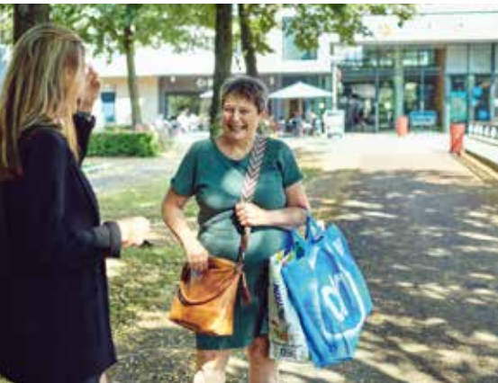
'Ik kom in het winkelcentrum meestal bekenden tegen'