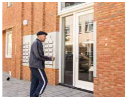
Naast de hoofdingang is een ontmoetingsruimte.