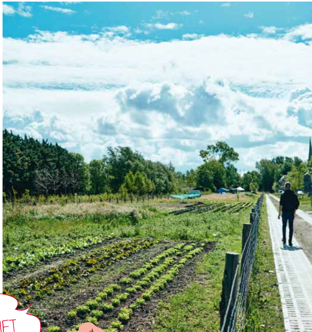
De Stadsboeren verbouwen biologische groenten in de wijk.

'IN DE ZOMER HOUDT DE POMP HET LEKKER KOEL'